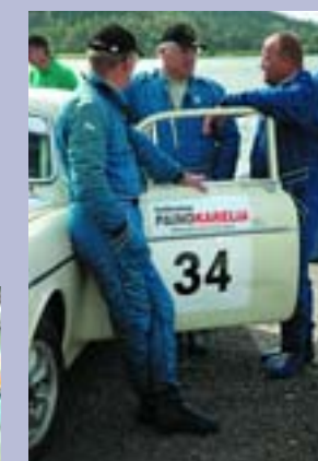
Гонщики облачены в специальные костюмы и обувь