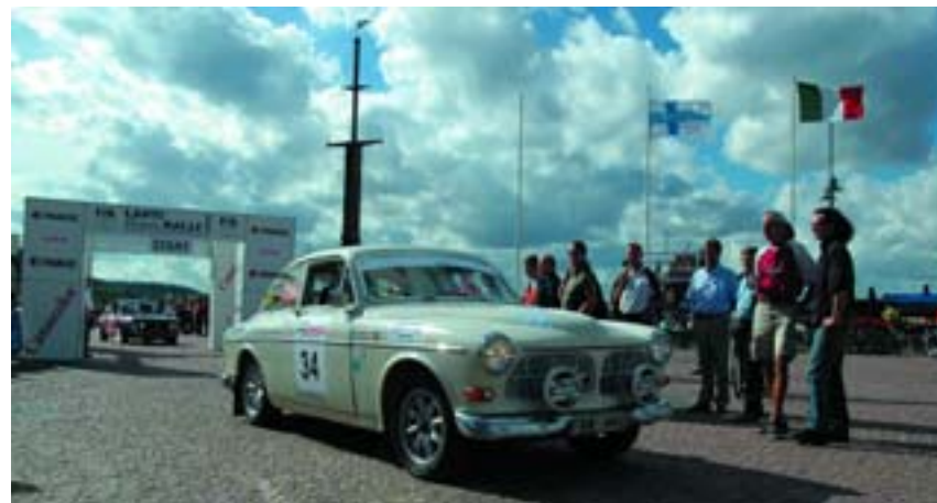
Volvo 122 (1965) уходит на дистанцию