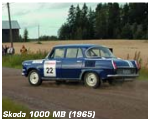
Skoda 1000 MB (1965)