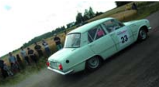
Isuzu Bellett (1965)