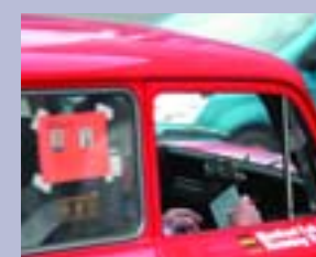
Штурманские приборы, наклейки с фамилиями гонщиков и карточка участника с фотографией – всё как положено в «настоящих» ралли