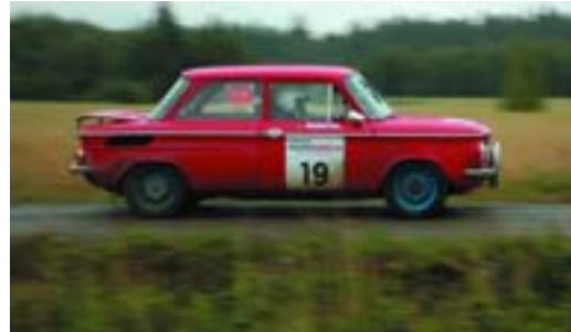
NSU TTS (1968)