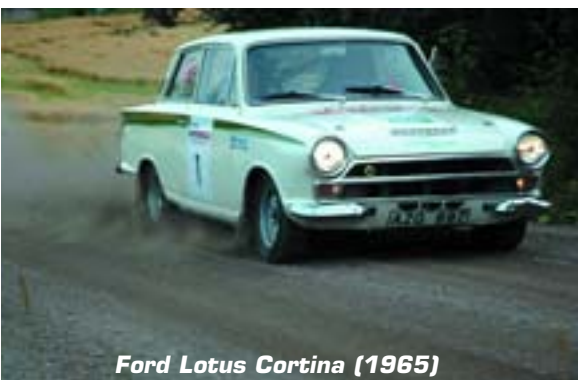
Ford Lotus Cortina (1965)