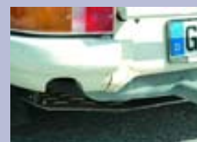
«Защита» двигателя По признанию одного из участников, подобный «тюнинг» серийного автомобиля обошёлся ему в 5000 Евро