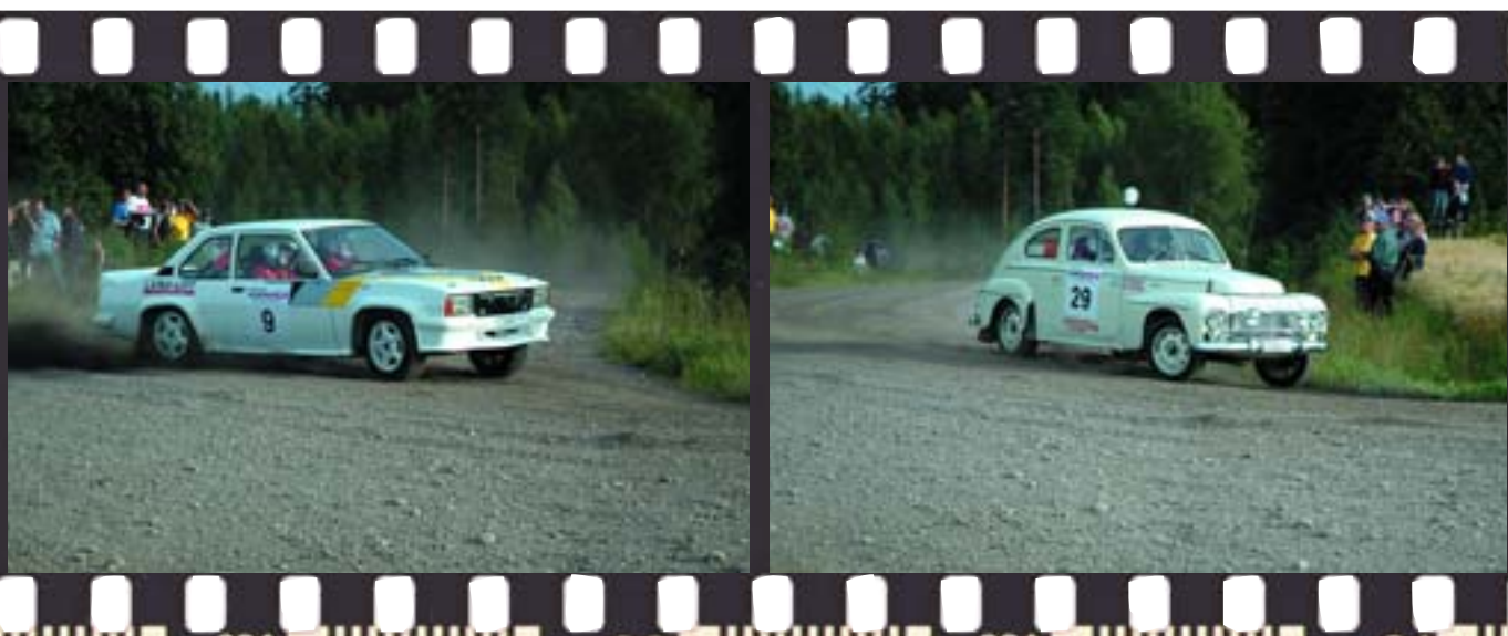
Один и тот же вираж с интервалом в несколько минут проходят Opel Ascona 400 (1979) и Volvo PV 444 (1957) – самый «юный» и самый «пожилой» участники ралли

Спортивные автомобили стареют быстро. Два-три сезона, несколько лет забвения и вот уже готовый экспонат музея, с биографией, ставшей историей и легендами, которые охотно придумывают очевидцы или те, кто выдаёт себя за очевидцев. Но поскольку очень многие спортивные автомобили – это собственность конкретных людей, а не безхозные инвентарные единицы любительских автоклубов, то их владельцы не всегда готовы просто взять и забыть былое. Да и как-то уж это слишком пессимистично – состариться вместе со своим автомобилем и быть в одночасье забытым. И многие владельцы гоночных машин не согласились с их очевидной старостью, особенно когда до собственной старости ещё – далеко. Поэтому на первую гонку древностей они выехали с прежним молодым задором и после этого уже не стали останавливаться, учреждая всё новые состязания отвоёвавшихся спортивных машин. Причём гонка Лондон – Брайтон настолько преуспела с тех пор, что сегодня стала одной из самых престижных. Именно на ней можно увидеть какой-нибудь