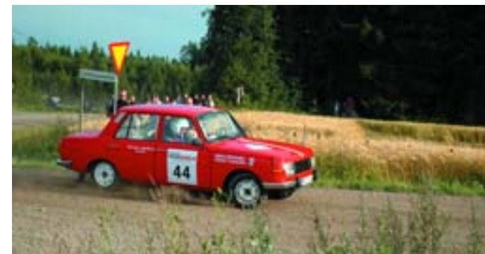
Wartburg 353 (1976) и Trabant 601 P (1964) публика почему-то неизменно встречала ироническим возласами