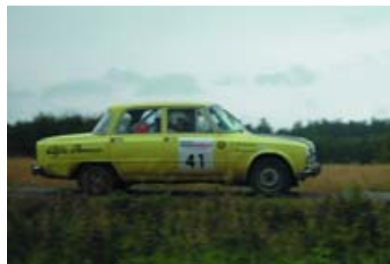
Alfa Romeo Giulia (1969)