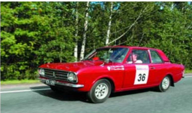
Ford Cortina GT (1969)