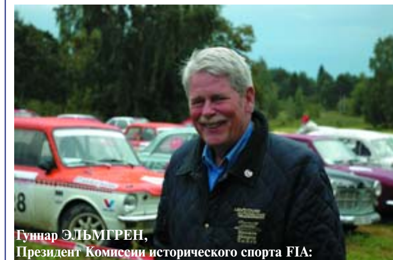
Гуннар ЭЛЬМГРЕН, Президент Комиссии исторического спорта FIA:

Именно так была создана традиция исторических соревнований, которая не только дожила до наших дней в виде автономного мероприятия самобеглых древностей, но и разрослась до масштабов обширного и уже всемирного явления – пробегов старинных автомобилей.