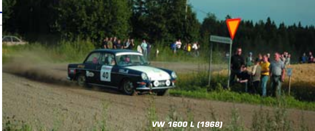
VW 1600 L (1968)