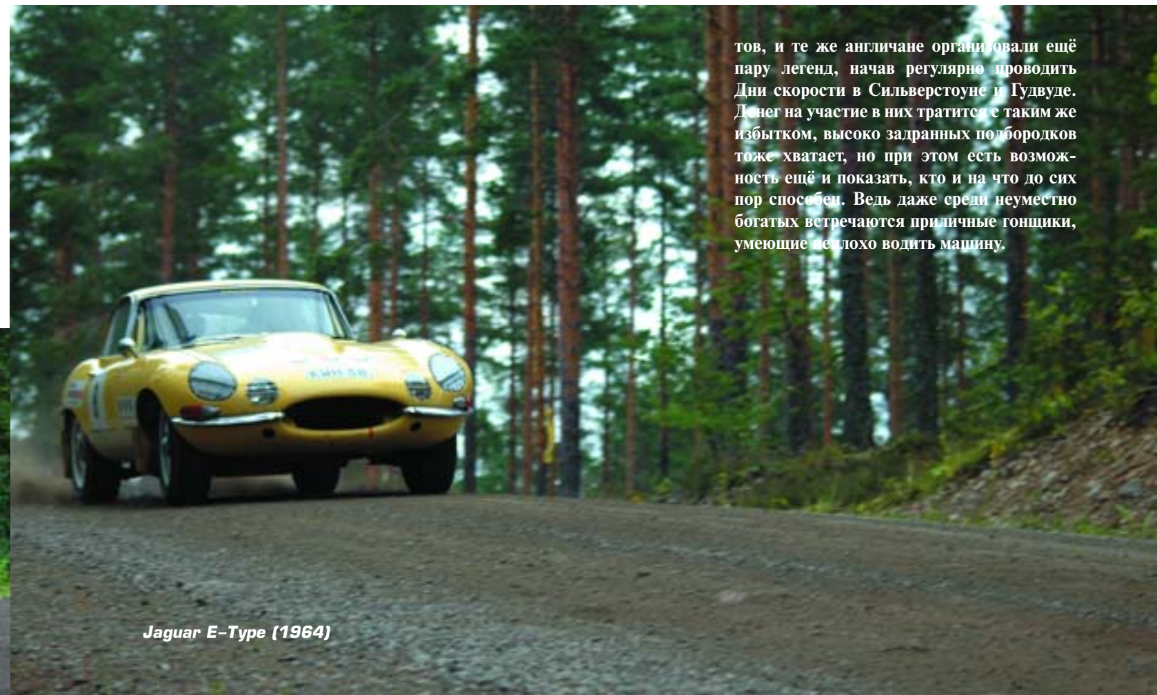
Jaguar E-Type (1964)