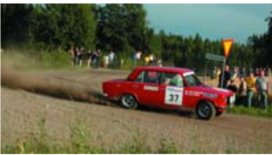
Fiat 124 Special (1971) – ни дать, ни взять – «копейка»