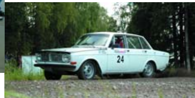
Volvo 144 S (1970)