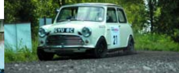
Малыш Morris Cooper S (1965) с британским экипажем на борту сражается «по-взрослому»