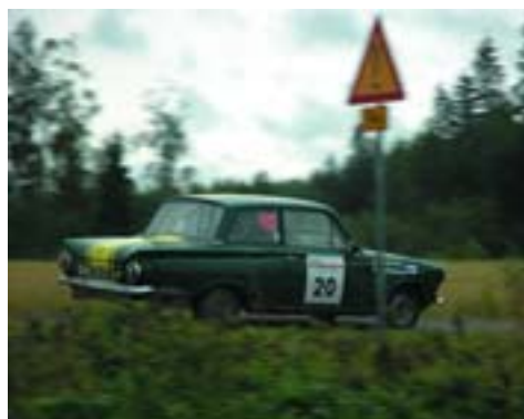
Ford Consul Cortina (1964)