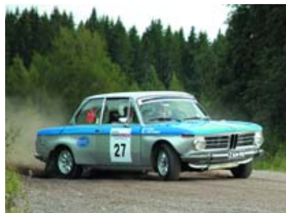
BMW 2002 TI (1969)