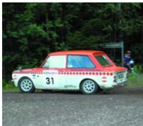
Sunbeam Imp (1968)