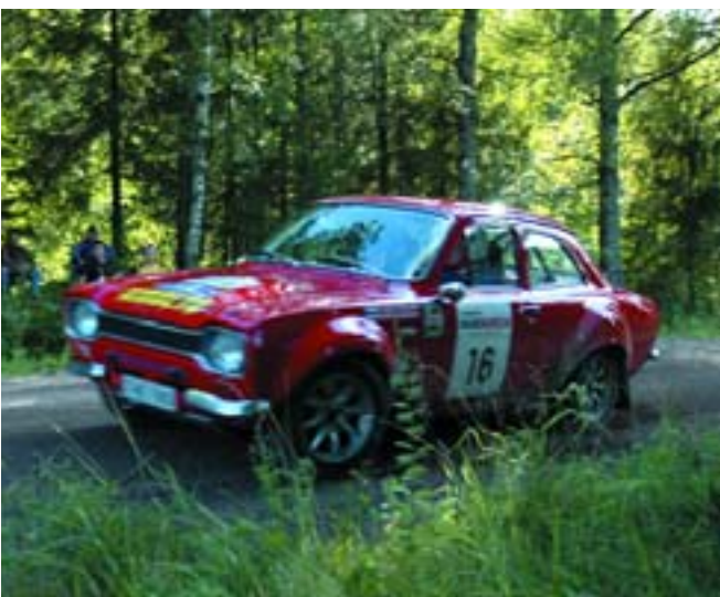
Ford Escort RS – самая массовая машина ралли – в Лаhti в этом году на таких автомобилях с двигателями 1,6 и 2 литра 1968–1974 годов выпуска стартовало сразу пять экипажей (четыре финских и один немецкий)

и те же англичане организовали ещё пару легенд, начав регулярно проводить Дни скорости в Сильверстоуне и Гудвуде. Деньги на участие в них тратятся с таким же избытком, высоко задранных полбородков тоже хватает, но при этом есть возможность ещё и показать, кто и на что до сих пор способен. Ведь даже среди неуместно богатых встречаются приличные гонщики, умеющие неплохо водить машину.