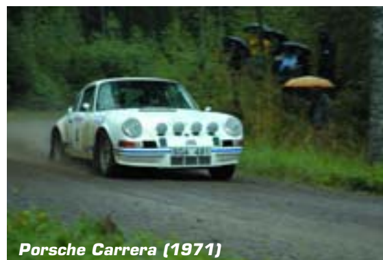
Porsche Carrera (1971)