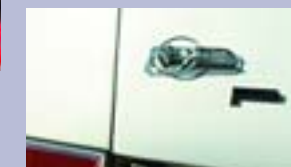
«Спортивные» замки крышки багажника и капота