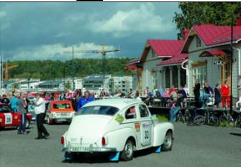
Шведский экипаж на Volvo PV 544 Sport выдвигается к стартовой позиции