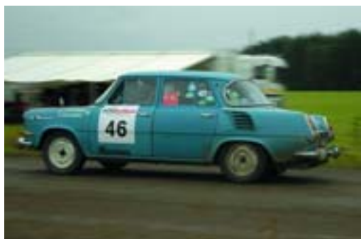
Skoda 1000 MB (1965)