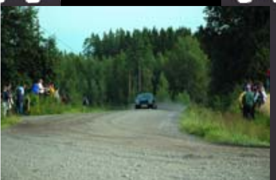
Sunbeam Avenger (1976)

сказано. Участие в ралли подразумевает такой невиданный избыток денег, при котором старинную машину можно себе позволить и разломать на куски. Чтоб потом купить следующую и ещё раз разломать. А, кроме того, коварство ралли Лаhti в том, что в нём охотно участвуют местные гонщики, которых всем прочим европейцам из благоустроенных асфальтовых стран очень трудно объехать, так как свои местные дороги они знают заведомо лучше, и гоняют по ним с рождения.