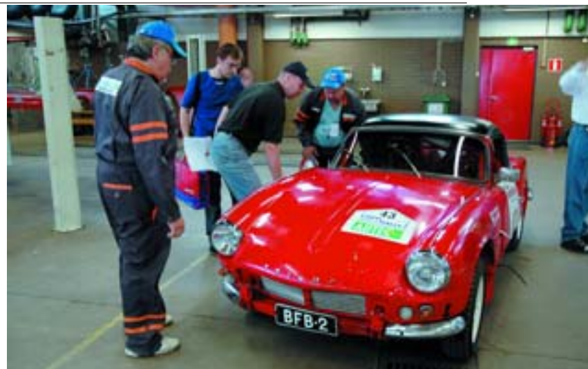
Triumph Spitfire (1965) на предстартовой технической инспекции