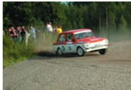
Sunbeam 900 (1969)