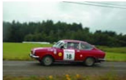
Fiat 850 Sport Coupe (1971)