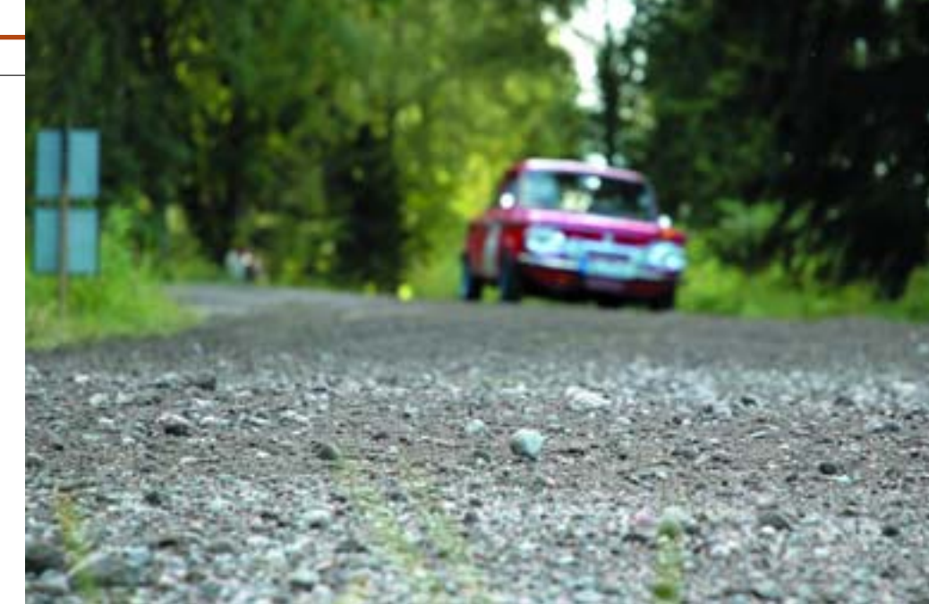
Lahti Historic Rally – единственное в Европе «ветеранское» соревнование, проводящееся на гравии