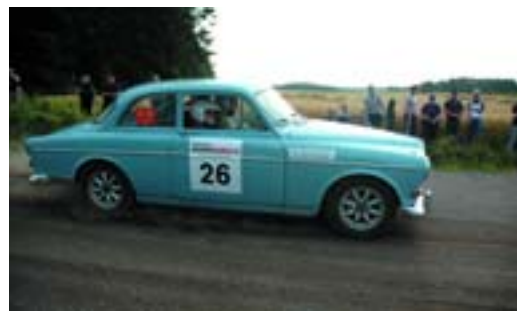
Volvo 122 (1964)