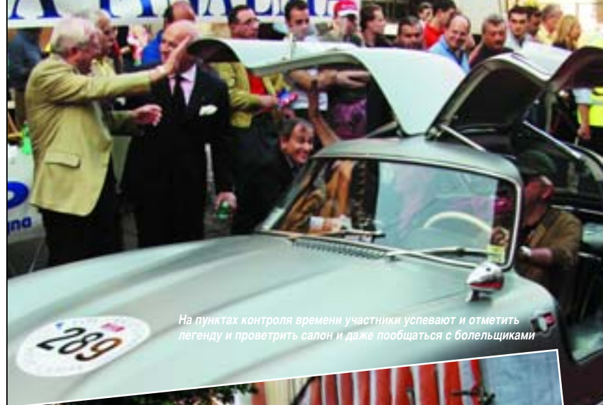
На пунктах контроля времени участники успевают и отметить легенду и проветрить салон и даже пообщаться с болельщиками