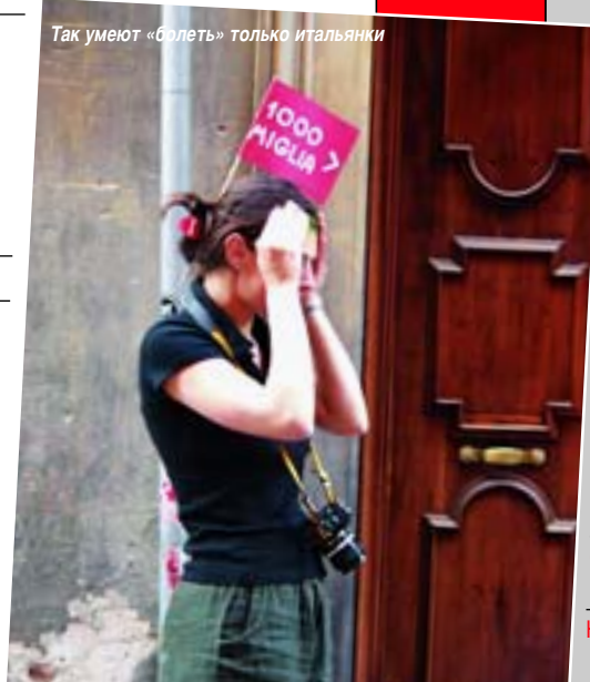
Так умеют «балеть» только итальянки