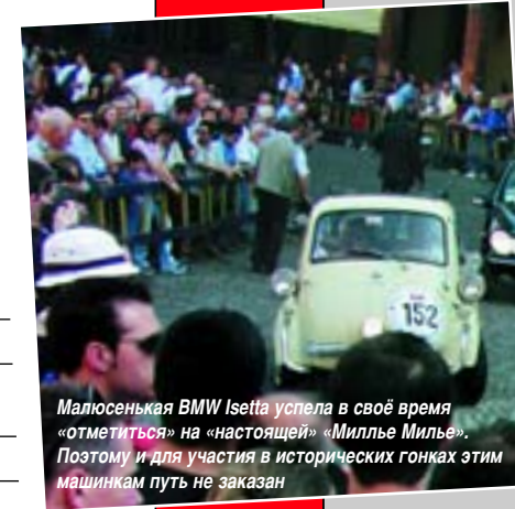
Малюсенькая BMW Isetta успела в своё время «отметиться» на «настоящей» «Миллье Милье». Поэтому и для участия в исторических гонках этим машинкам путь не заказан