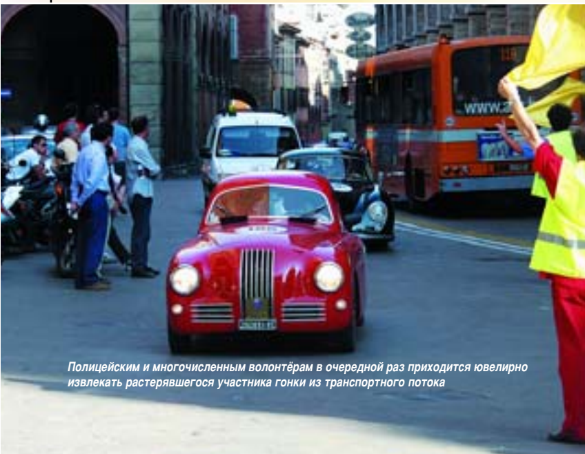
Полицейским и многочисленным волонтерам в очередной раз приходится ювелирно извлекать растерявшегося участника гонки из транспортного потока

Предлагаем Вашему вниманию исчерпывающий список автомобилей, допущенных к участию и стартовавших в «Mille Miglia storico» с момента её возрождения в 1982 году по настоящее время, любезно предоставленный редакции организаторами гонки: Comitato Organizzatore Mille Miglia.