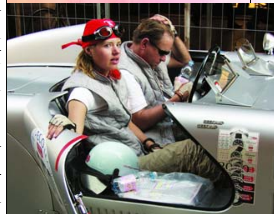
Судя по многочисленным наклейкам на бортах, для этого Veritas RS2000 нынешняя «тысяча миль» далеко не первая. И, разумеется, не последняя

Адрес официального интернет-сайта гонки http://www.millemiglia.it (язык сайта – итальянский, имеется также английская версия).