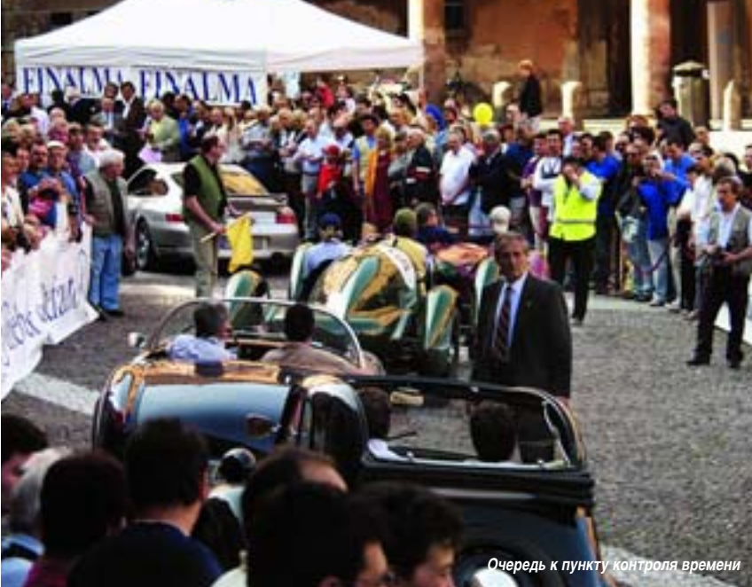
Очередь к пункту контроля времени