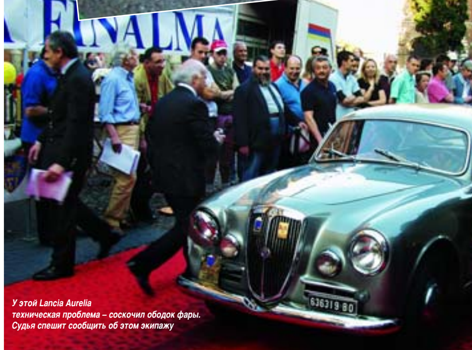
У этой Lancia Aurelia техническая проблема – соскочил ободок фары. Судья спешит сообщить об этом экипажу